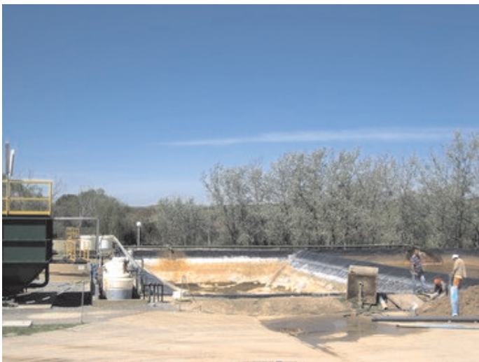
Plantas de Tratamiento de Líquidos Lixiviados (1) en el Complejo Ambiental Villa Domínico

Desde su creación, las regionales de la universidad tecnológica, han desarrollado una importante vinculación con su entorno productivo y social. Sin embargo, en los últimos años, las acciones de articulación se han consolidado y son consideradas estratégicas para la formación de los futuros ingenieros. En línea con el Plan estratégico de formación de ingenieros 2012-2016 , desde hace más de dos años la UTN-FRA lleva adelante desde sus diversas funciones (docencia-investigación-extensión) una serie de actividades que permiten una mayor integración de la facultad con el medio educativo, social y productivo de la región, potenciando su rol creador y transformador de la realidad social de su medio. En esta oportunidad centraremos el análisis en la importancia que conllevan las instancias formadoras en torno a las visitas guiadas que llevan adelante diferentes materias y/o laboratorios de investigación y