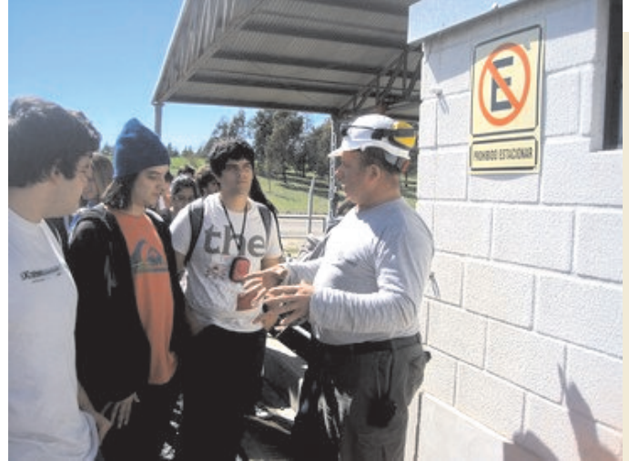
Técnico responsable de la Planta que transforma el metano en dióxido de carbono y alumnos de primer año de ingeniería de la UTN-FRA.

desarrollo de la FRA hacia las empresas de su zona de influencia (2).